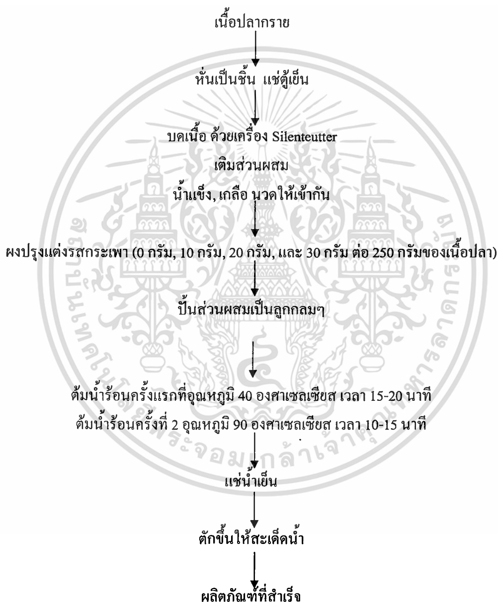
ภาพที่ 1 ขั้นตอนการผลิตลูกชิ้นปลาเสริมผงปรุงแต่งรสกระเพรา

ชนิดของผงปรุงรสที่คัดเลือกได้จากข้อ 3.2.1 คือ รสกระเพรา นำมาศึกษาอัตราส่วนที่เหมาะสมในการเสริมในผลิตภัณฑ์ลูกชิ้นปลา โดยมีสูตรการทดลองดังตารางที่ 6 และขั้นตอนการผลิตลูกชิ้น ดังภาพที่ 1 จากนั้นนำผลิตภัณฑ์ที่ได้ไปทดสอบทางประสาทสัมผัสเพื่อ หาคความแตกต่างของผลิตภัณฑ์ลูกชิ้น ผลการทดลองข้อมูลที่ได้จากการทดลองนำมาประมวลผลทางสถิติ โดยวิเคราะห์ค่าความแตกต่างทางสถิติที่ระดับความเชื่อมั่น ร้อยละ 95