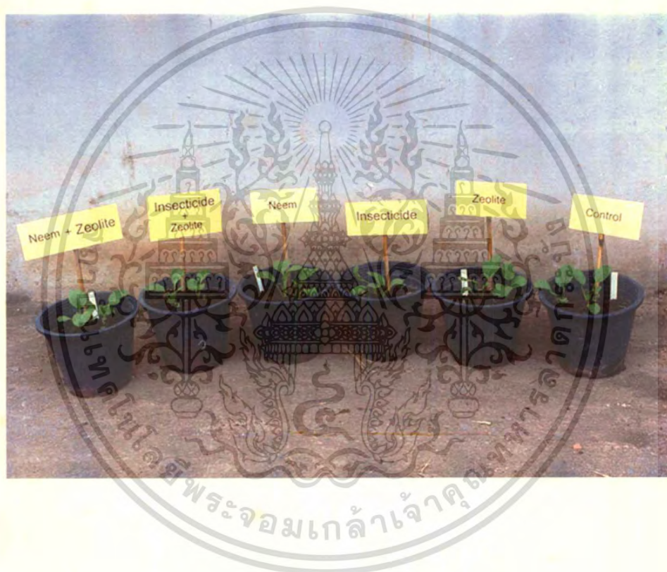
ภาพที่ 1 ลักษณะของผักกวางตุ้งในระยะต้นกล้าเมื่ออายุ 14 วัน

เอกสารนี้เป็นเอกสารที่สงวนไว้สำหรับการใช้งานเพื่อการศึกษาเท่านั้น ไม่อนุญาตให้นำไปใช้ประโยชน์ด้านการค้า ไม่ว่ากรณีใดๆทั้งสิ้น อีกทั้งห้ามมิให้ดัดแปลงเนื้อหา และต้องอ้างอิงถึงเจ้าของเอกสารทุกครั้งที่มีการนำไปใช้