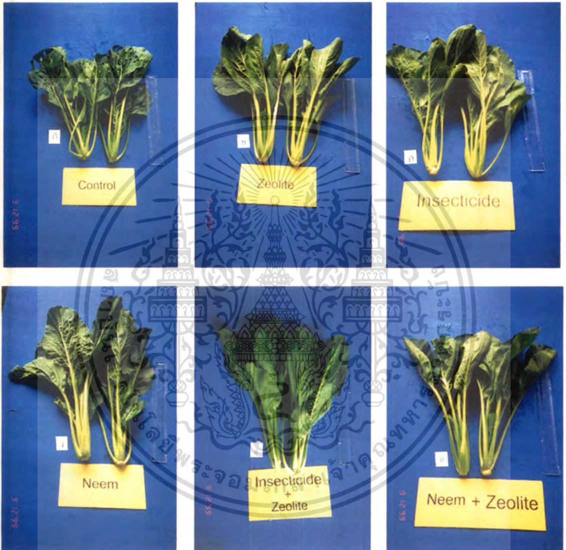
ภาพที่ 3 ลักษณะของผักกวางตุ้งหลังการเก็บเกี่ยว ก) ไม่ฉีดพ่นสาร ข) ฉีดสารไอไลท์ ค) ฉีดสารเคมี ง) ฉีดสารสกัดจากเมล็ดสะเดา จ) ฉีดสารซีไอไลท์ร่วมกับสารเคมี ฉ) ฉีดสารซีไอไลท์ร่วมกับสกัดจากเมล็ดสะเดา

เอกสารนี้เป็นเอกสารที่สงวนไว้สำหรับการใช้งานเพื่อการศึกษาเท่านั้น ไม่อนุญาตให้นำไปใช้ประโยชน์ด้านการค้า ไม่ว่าจะกรณีใดๆทั้งสิ้น อีกทั้งห้ามมิให้ดัดแปลงเนื้อหา และต้องอ้างอิงถึงเจ้าของเอกสารทุกครั้งที่มีการนำไปใช้