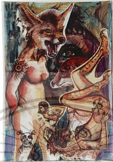
ภาพร่าง (Sketch) ที่ 3