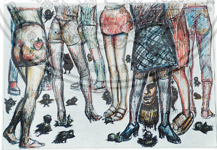
ภาพร่าง (Sketch) ที่ 2

เอกสารนี้เป็นเอกสารที่สงวนไว้สำหรับการใช้งานเพื่อการศึกษาเท่านั้น ไม่อนุญาตให้นำไปใช้ประโยชน์ด้านการค้า ไม่ว่าจะกรณีใดๆ ทั้งสิ้น อีกทั้งห้ามมิให้ดัดแปลงเนื้อหา และต้องอ้างอิงถึงเจ้าของเอกสารทุกครั้งที่มีการนำไปใช้