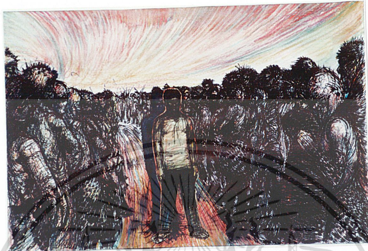
ภาพร่าง (Sketch) ที่ 1