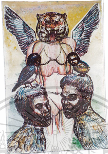
ภาพร่าง (Sketch) ที่ 1