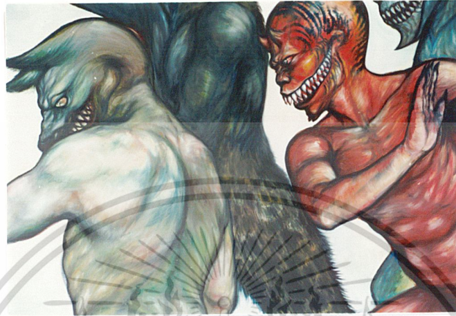
ภาพร่าง จากผลงานศิลปะนิพนธ์ภาพที่ 3