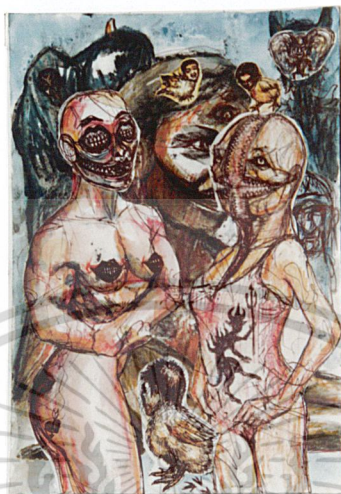
ภาพร่าง (Sketch) ที่ 1