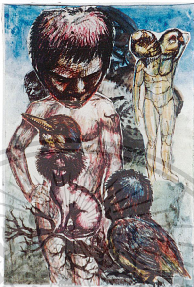
ภาพร่าง (Sketch) ที่ 3