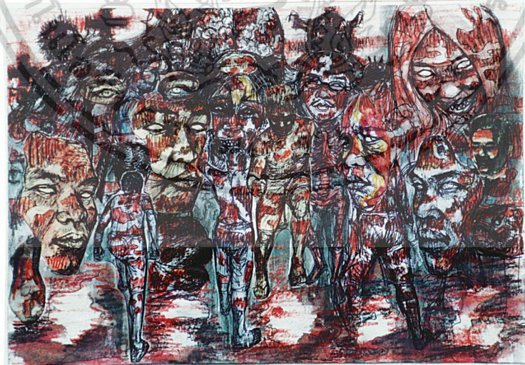
ภาพร่าง (Sketch) ที่ 2

เอกสารนี้เป็นเอกสารที่สงวนไว้สำหรับการใช้งานเพื่อการศึกษาเท่านั้น ไม่อนุญาตให้นำไปใช้ประโยชน์ด้านการค้า ไม่ว่ากรณีใดๆ ทั้งสิ้น อีกทั้งห้ามมิให้ดัดแปลงเนื้อหา และต้องอ้างอิงถึงเจ้าของเอกสารทุกครั้งที่มีการนำไปใช้