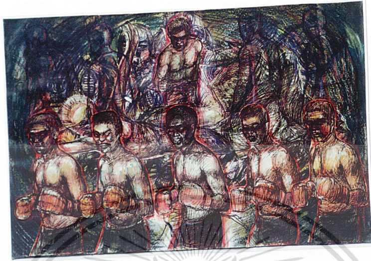
ภาพร่าง (Sketch) ที่ 3