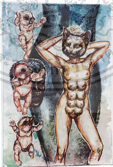
ภาพร่าง (Sketch) ที่ 2

เอกสารนี้เป็นเอกสารที่สงวนไว้สำหรับการใช้งานเพื่อการศึกษาเท่านั้น ไม่อนุญาตให้นำไปใช้ประโยชน์ด้านการค้า ไม่ว่ากรณีใดๆ ทั้งสิ้น อีกทั้งห้ามมิให้ตัดแปลงเนื้อหา และต้องอ้างอิงถึงเจ้าของเอกสารทุกครั้งที่มีการนำไปใช้