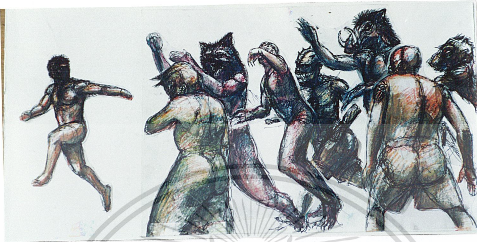
ภาพร่าง (Sketch) ที่ 3