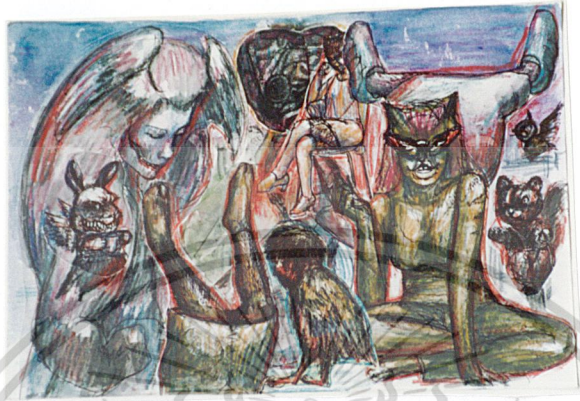
ภาพร่าง (Sketch) ที่ 1