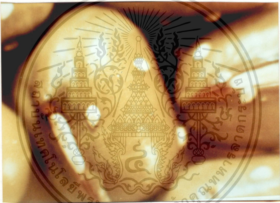
ภาพที่ 3 ลักษณะของ ไข่ด้วงถั่วเขียว ( Callosobruchus maculatus F.) ที่ติดบนเปลือกเมล็ดถั่วเขียว

เอกสารนี้เป็นเอกสารที่สงวนไว้สำหรับการใช้งานเพื่อการศึกษาเท่านั้น ไม่อนุญาตให้นำไปใช้ประโยชน์ด้านการค้า ไม่ว่ากรณีใดๆทั้งสิ้น อีกทั้งห้ามมิให้ดัดแปลงเนื้อหา และต้องอ้างอิงถึงเจ้าของเอกสารทุกครั้งที่มีการนำไปใช้