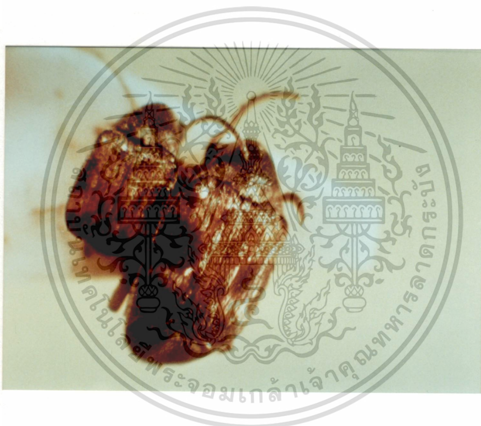
ภาพที่ 1 ตัวเต็มวัยของตัวงั่วเขียว ( Callosobruchus maculatus F.) เพศผู้ (ซ้าย) และเพศเมีย (ขวา)

เอกสารนี้เป็นเอกสารที่สงวนไว้สำหรับการใช้งานเพื่อการศึกษาเท่านั้น ไม่อนุญาตให้นำไปใช้ประโยชน์ด้านการค้า ไม่ว่ากรณีใดๆทั้งสิ้น อีกทั้งห้ามมิให้ดัดแปลงเนื้อหา และต้องอ้างอิงถึงเจ้าของเอกสารทุกครั้งที่มีการนำไปใช้