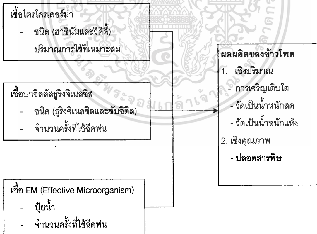
ภาพที่ 1. กรอบแนวคิดในการวิจัยเกี่ยวกับเกษตรอินทรีย์

กรอบแนวคิดที่ใช้ในการวิจัยประกอบด้วยตัวแปรอิสระและตัวแปรตามดังแสดงในภาพที่ 1