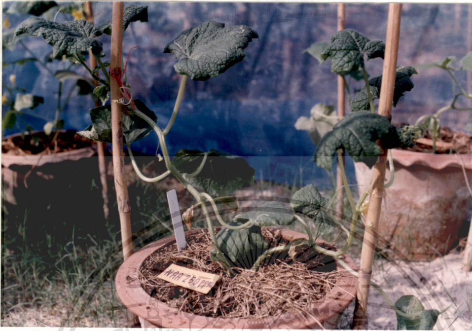
รูปที่ 21 NAA 250 ppm (35 วัน)