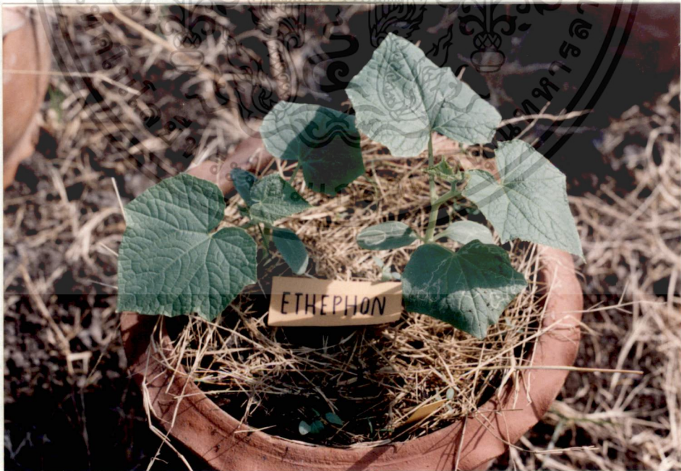
รูปที่ 4 หลังจากพ่น ethephon ครั้งที่ 1 ได้ 2 วัน

เอกสารนี้เป็นเอกสารที่สงวนไว้สำหรับการใช้งานเพื่อการศึกษาเท่านั้น ไม่อนุญาตให้นำไปใช้ประโยชน์ด้านการค้า ไม่ว่ากรณีใดๆทั้งสิ้น อีกทั้งห้ามมิให้ดัดแปลงเนื้อหา และต้องอ้างอิงถึงเจ้าของเอกสารทุกครั้งที่มีการนำไปใช้