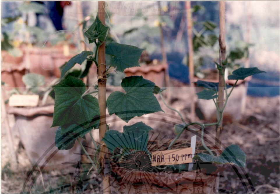
รูปที่ 19 NAA 150 ppm (35 วัน)