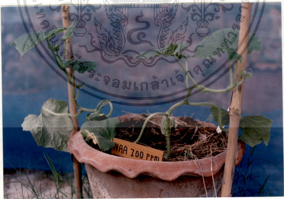
รูปที่ 20 NAA 200 ppm (35 วัน)

เอกสารนี้เป็นเอกสารที่สงวนไว้สำหรับการใช้งานเพื่อการศึกษาเท่านั้น ไม่อนุญาตให้นำไปใช้ประโยชน์ด้านการค้า ไม่ว่ากรณีใดๆทั้งสิ้น อีกทั้งห้ามมิให้ดัดแปลงเนื้อหา และต้องอ้างอิงถึงเจ้าของเอกสารทุกครั้งที่มีการนำไปใช้