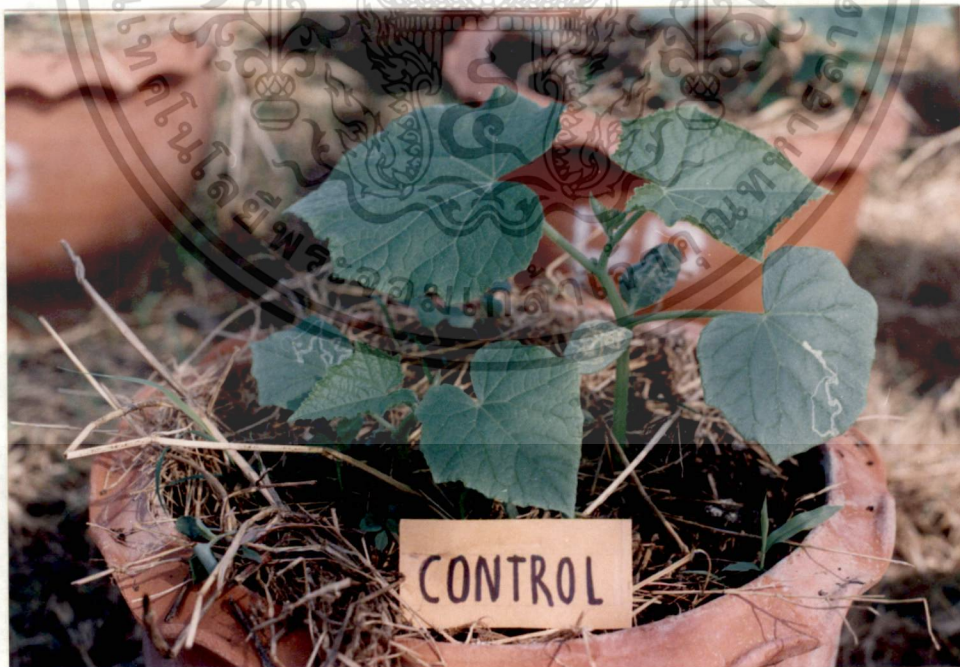
รูปที่ 2 Control แดงกวา อายุ 17 วัน

เอกสารนี้เป็นเอกสารที่สงวนไว้สำหรับการใช้งานเพื่อการศึกษาเท่านั้น ไม่อนุญาตให้นำไปใช้ประโยชน์ด้านการค้า ไม่ว่าจะกรณีใดๆทั้งสิ้น อีกทั้งห้ามมิให้ดัดแปลงเนื้อหา และต้องอ้างอิงถึงเจ้าของเอกสารทุกครั้งที่มีการนำไปใช้