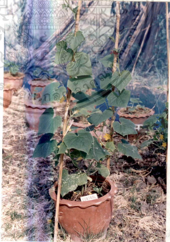
รูปที่ 6 Control แตงกวา อายุ 35 วัน

เอกสารนี้เป็นเอกสารที่สงวนไว้สำหรับการใช้ภายในเท่านั้น ไม่ควรเผยแพร่สู่สาธารณะโดยไม่ผ่านการคัดค้าน ไม่ว่ากรณีใดๆทั้งสิ้น อีกทั้งห้ามมิให้ดัดแปลงเนื้อหา และต้องอ้างอิงถึงเจ้าของเอกสารทุกครั้งที่มีการนำไปใช้