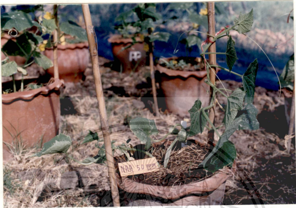
รูปที่ 17 NAA 50 ppm (35 วัน)