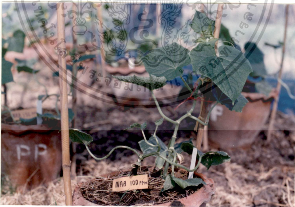
รูปที่ 18 NAA 100 ppm (35 วัน)

เอกสารนี้เป็นเอกสารที่สงวนไว้สำหรับการใช้งานเพื่อการศึกษาเท่านั้น ไม่อนุญาตให้นำไปใช้ประโยชน์ด้านการค้า ไม่ว่ากรณีใดๆทั้งสิ้น อีกทั้งห้ามมิให้ดัดแปลงเนื้อหา และต้องอ้างอิงถึงเจ้าของเอกสารทุกครั้งที่มีการนำไปใช้