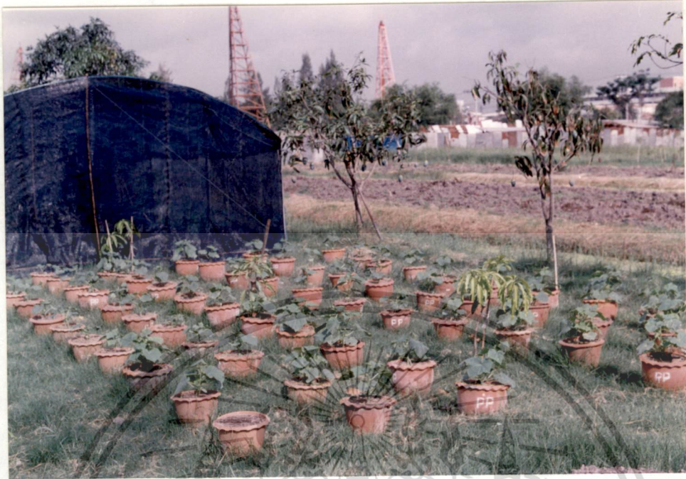
รูปที่ 1 แดงกวา อายุ 17 วัน (หลังฉีดพ่นสาร ครั้งที่ 1 ได้ 2 วัน)