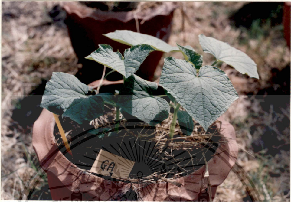
รูปที่ 3 หลังจากพ่น GA ครั้งที่ 1 ได้ 2 วัน