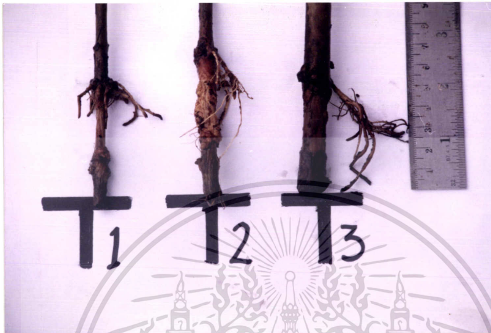
ภาพแสดงจำนวนรากและความยาวรากเฉลี่ยของกิ่งตองฝรั่งอายุ 60 วัน

เอกสารนี้เป็นเอกสารที่สงวนไว้สำหรับการใช้งานเพื่อการศึกษาเท่านั้น ไม่อนุญาตให้นำไปใช้ประโยชน์ด้านการค้า ไม่ว่ากรณีใดๆทั้งสิ้น อีกทั้งห้ามมิให้ดัดแปลงเนื้อหา และต้องอ้างอิงถึงเจ้าของเอกสารทุกครั้งที่มีการนำไปใช้