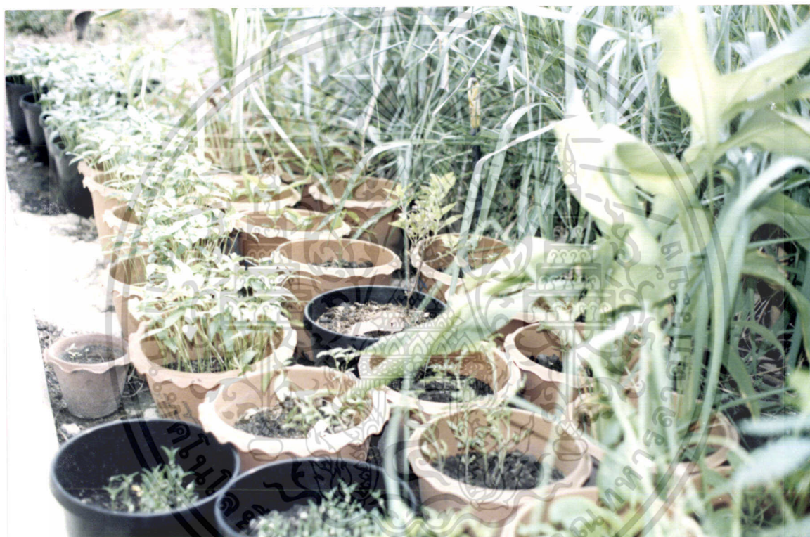
ภาพที่ 2 แผนผังการวางกระถางปลูกผักของกลุ่มผักกับพืชผสมผสาน ซึ่งมี การปลูกพืชชนิดต่างๆ ร่วมกับผัก

เอกสารนี้เป็นเอกสารที่สงวนไว้สำหรับการใช้งานเพื่อการศึกษาเท่านั้น ไม่อนุญาตให้นำไปใช้ประโยชน์ด้านการค้า ไม่ว่ากรณีใดๆทั้งสิ้น อีกทั้งห้ามมิให้ดัดแปลงเนื้อหา และต้องอ้างอิงถึงเจ้าของเอกสารทุกครั้งที่มีการนำไปใช้