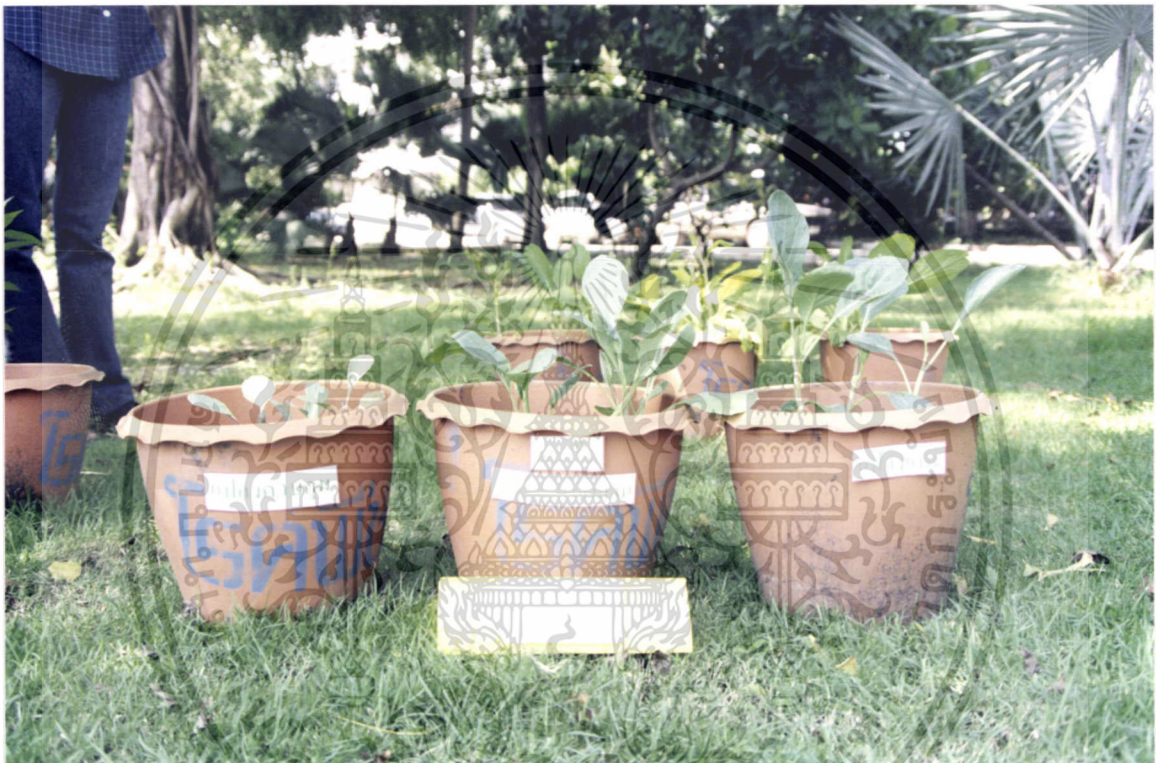
ภาพที่ 8 การเจริญเติบโตของคะน้ำทั้ง 3 กลุ่มผัก

เอกสารนี้เป็นเอกสารที่สงวนไว้สำหรับการใช้งานเพื่อการศึกษาเท่านั้น ไม่อนุญาตให้นำไปใช้ประโยชน์ด้านการค้า ไม่ว่าจะกรณีใดๆทั้งสิ้น อีกทั้งห้ามมิให้ดัดแปลงเนื้อหา และต้องอ้างอิงถึงเจ้าของเอกสารทุกครั้งที่มีการนำไปใช้