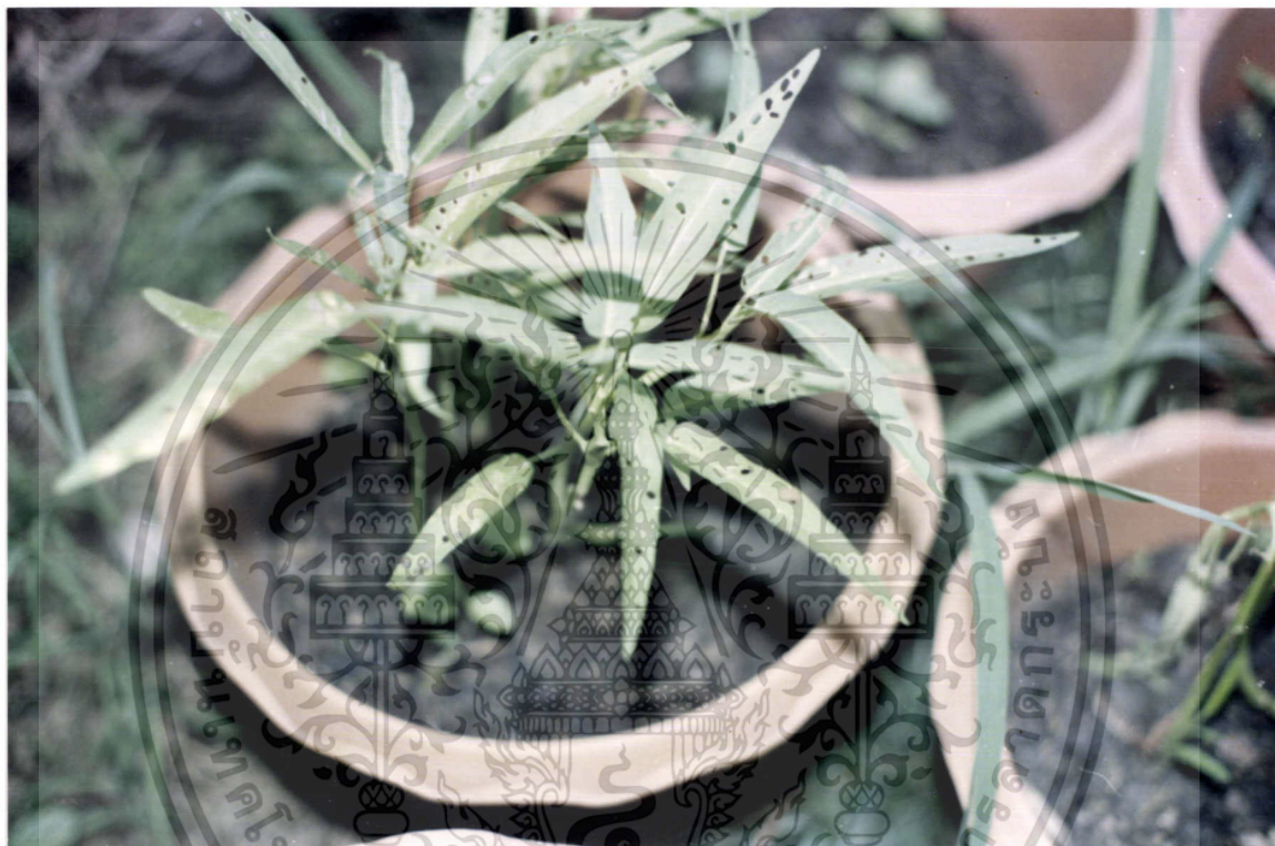
ภาพที่ 3 ค้างคาวเงินผักบุ้ง และค้างคาวทองผักบุ้งกัดกินใบผักบุ้งเป็นรูพรุน

เอกสารนี้เป็นเอกสารที่สงวนไว้สำหรับการใช้งานเพื่อการศึกษาเท่านั้น ไม่อนุญาตให้นำไปใช้ประโยชน์ด้านการค้า ไม่ว่ากรณีใดๆทั้งสิ้น อีกทั้งห้ามมิให้ดัดแปลงเนื้อหา และต้องอ้างอิงถึงเจ้าของเอกสารทุกครั้งที่มีการนำไปใช้