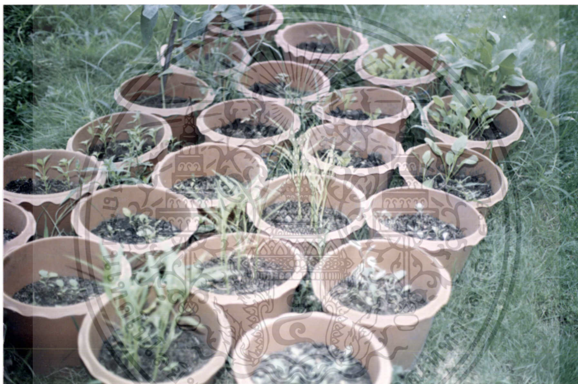
ภาพที่ 1 แผนผังการวางกระถางปลูกผักของกลุ่มผักควบคุม และกลุ่มผัก ไร่ บุญเคมี

เอกสารนี้เป็นเอกสารที่สงวนไว้สำหรับการใช้งานเพื่อการศึกษาเท่านั้น ไม่อนุญาตให้นำไปใช้ประโยชน์ด้านการค้า ไม่ว่ากรณีใดๆทั้งสิ้น อีกทั้งห้ามมิให้ดัดแปลงเนื้อหา และต้องอ้างอิงถึงเจ้าของเอกสารทุกครั้งที่มีการนำไปใช้