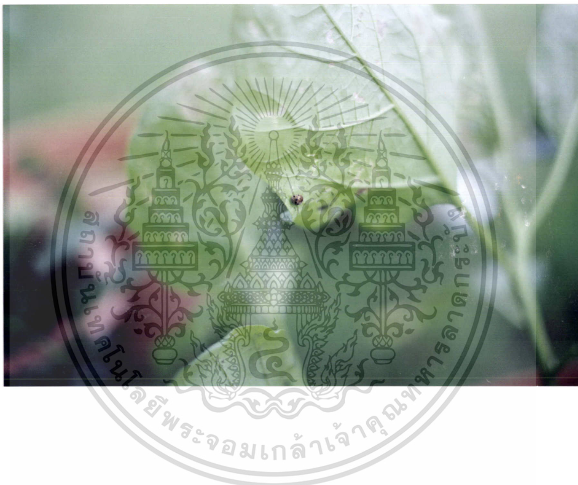
ภาพที่ 4 ค้างแต่มะเขือ กัดกินใบมะเขือเป็นรูพรุน ปรุโปร่งลักษณะคล้ายชั้น บันไดทำให้ใบเหลือง

เอกสารนี้เป็นเอกสารที่สงวนไว้สำหรับการใช้งานเพื่อการศึกษาเท่านั้น ไม่อนุญาตให้นำไปใช้ประโยชน์ด้านการค้า ไม่ว่ากรณีใดๆทั้งสิ้น อีกทั้งห้ามมิให้ดัดแปลงเนื้อหา และต้องอ้างอิงถึงเจ้าของเอกสารทุกครั้งที่มีการนำไปใช้