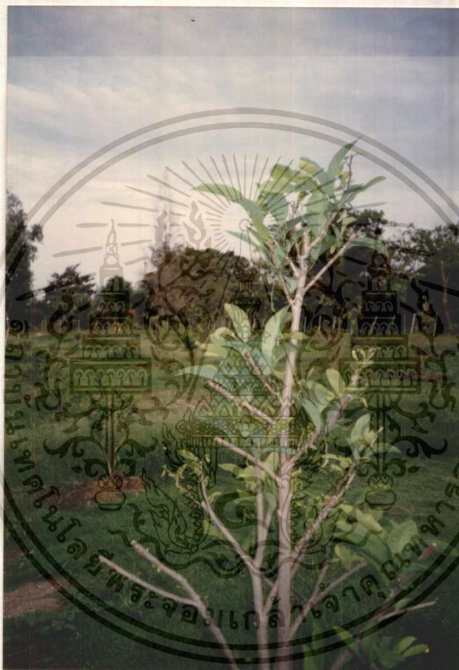
ภาพที่ 5 แสดงต้นน้อยหน่าที่ความเข้มข้น 10,000 ppm.หลังพ่นสาร GA 3 แล้ว 30 วัน

เอกสารนี้เป็นเอกสารที่สงวนไว้สำหรับการใช้งานเพื่อการศึกษาเท่านั้น ไม่อนุญาตให้นำไปใช้ประโยชน์ด้านการค้า ไม่ว่ากรณีใดๆทั้งสิ้น อีกทั้งห้ามมิให้ดัดแปลงเนื้อหา และต้องอ้างอิงถึงเจ้าของเอกสารทุกครั้งที่มีการนำไปใช้