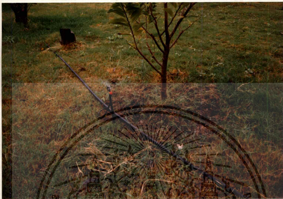
ภาพที่ 3 แสดงการพรุนดิน ใส่ปุ๋ยน้อยหน้า หลังการตัดแต่งกิ่งแล้ว