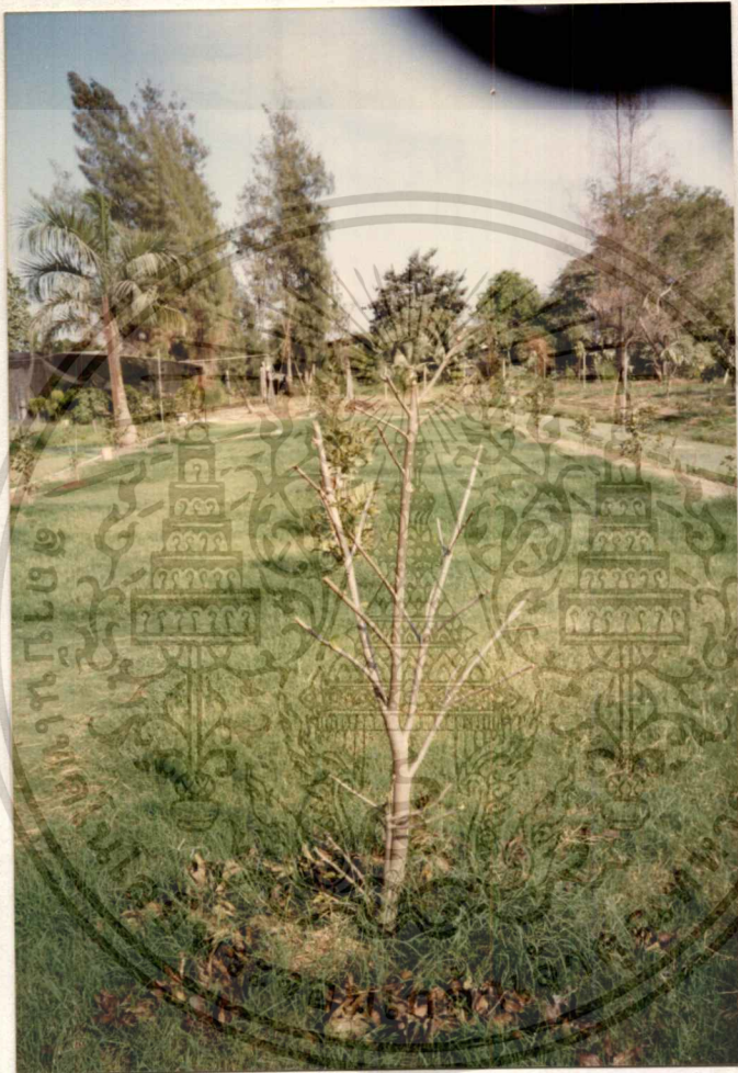
ภาพที่ 2 แสดงต้นน้อยหน่าหลังการตัดแต่งกิ่ง

เอกสารนี้เป็นเอกสารที่สงวนไว้สำหรับการใช้งานเพื่อการศึกษาเท่านั้น ไม่อนุญาตให้นำไปใช้ประโยชน์ด้านการค้า ไม่ว่ากรณีใดๆทั้งสิ้น อีกทั้งห้ามมิให้ดัดแปลงเนื้อหา และต้องอ้างอิงถึงเจ้าของเอกสารทุกครั้งที่มีการนำไปใช้