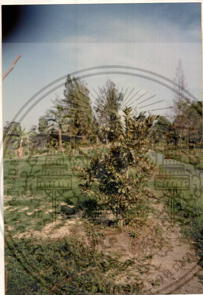
ภาพที่ 1 แสดงต้นน้อยหน่าก่อนการตัดแต่งกิ่ง

เอกสารนี้เป็นเอกสารที่สงวนไว้สำหรับการใช้งานเพื่อการศึกษาเท่านั้น ไม่อนุญาตให้นำไปใช้ประโยชน์ด้านการค้า ไม่ว่ากรณีใดๆทั้งสิ้น อีกทั้งห้ามมิให้ดัดแปลงเนื้อหา และต้องอ้างอิงถึงเจ้าของเอกสารทุกครั้งที่มีการนำไปใช้