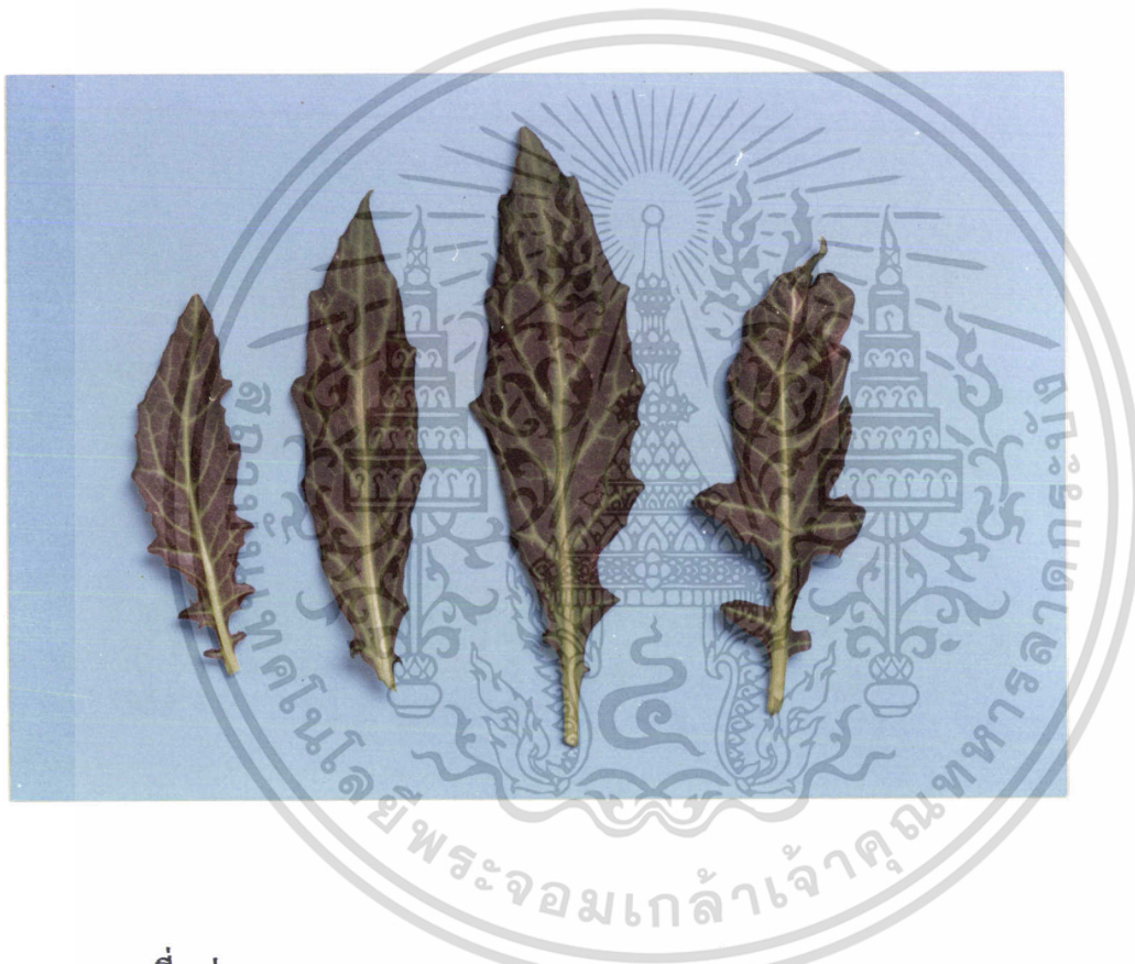
ภาพที่ 5 ว่านมหากาฬ ( Gynura pseudochina DC. var. hispuda Thv.)

เอกสารนี้เป็นเอกสารที่สงวนไว้สำหรับการใช้งานเพื่อการศึกษาเท่านั้น ไม่อนุญาตให้นำไปใช้ประโยชน์ด้านการค้า ไม่ว่ากรณีใดๆทั้งสิ้น อีกทั้งห้ามมิให้ดัดแปลงเนื้อหา และต้องอ้างอิงถึงเจ้าของเอกสารทุกครั้งที่มีการนำไปใช้