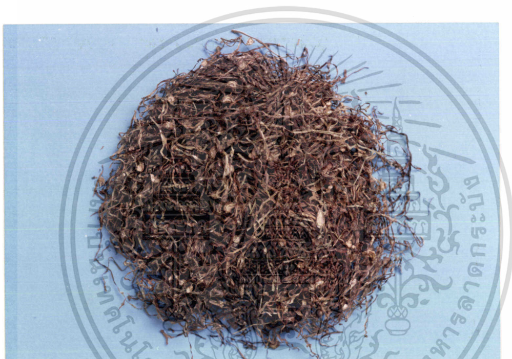
ภาพที่ 4 ยาสูบ ( Nicotiana tabacum Linn.)

เอกสารนี้เป็นเอกสารที่สงวนไว้สำหรับการใช้งานเพื่อการศึกษาเท่านั้น ไม่อนุญาตให้นำไปใช้ประโยชน์ด้านการค้า ไม่ว่าจะกรณีใดๆทั้งสิ้น อีกทั้งห้ามมิให้ดัดแปลงเนื้อหา และต้องอ้างอิงถึงเจ้าของเอกสารทุกครั้งที่มีการนำไปใช้