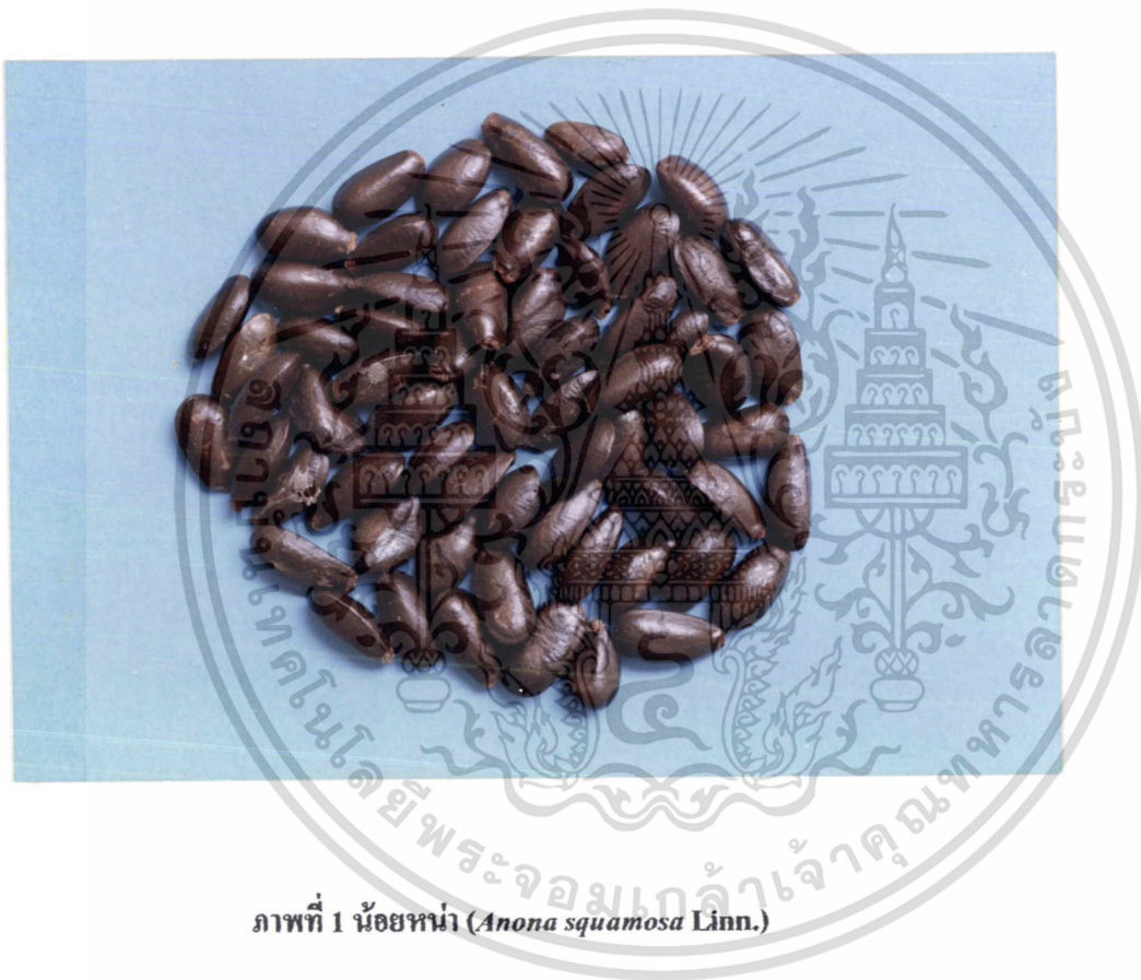
ภาพที่ 1 น้อยหน้า ( Anona squamosa Linn.)

เอกสารนี้เป็นเอกสารที่สงวนไว้สำหรับการใช้งานเพื่อการศึกษาเท่านั้น ไม่อนุญาตให้นำไปใช้ประโยชน์ด้านการค้า ไม่ว่าจะกรณีใดๆทั้งสิ้น อีกทั้งห้ามมิให้ดัดแปลงเนื้อหา และต้องอ้างอิงถึงเจ้าของเอกสารทุกครั้งที่มีการนำไปใช้