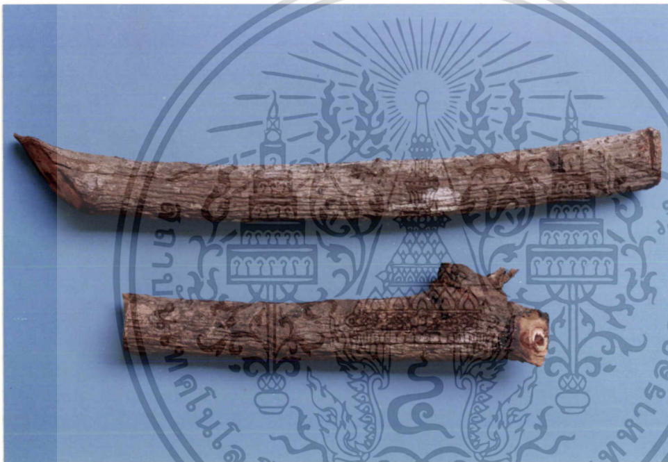
ภาพที่ 8 หางไหลแดง ( Derris elliptica Benth.)

เอกสารนี้เป็นเอกสารที่สงวนไว้สำหรับการใช้งานเพื่อการศึกษาเท่านั้น ไม่อนุญาตให้นำไปใช้ประโยชน์ด้านการค้า ไม่ว่าจะกรณีใดๆทั้งสิ้น อีกทั้งห้ามมิให้ดัดแปลงเนื้อหา และต้องอ้างอิงถึงเจ้าของเอกสารทุกครั้งที่มีการนำไปใช้