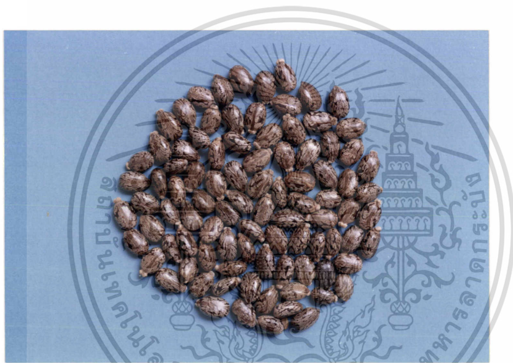
ภาพที่ 6 ละหุ่ง( Ricinus communis Linn.)

เอกสารนี้เป็นเอกสารที่สงวนไว้สำหรับการใช้งานเพื่อการศึกษาเท่านั้น ไม่อนุญาตให้นำไปใช้ประโยชน์ด้านการค้า ไม่ว่าจะกรณีใดๆทั้งสิ้น อีกทั้งห้ามมิให้ดัดแปลงเนื้อหา และต้องอ้างอิงถึงเจ้าของเอกสารทุกครั้งที่มีการนำไปใช้