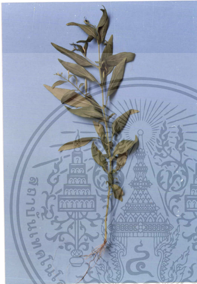
ภาพที่ 3 ฟ้ายะลวยโจร( Andrographis paniculata Wall.ex Nees.)

เอกสารนี้เป็นเอกสารที่สงวนไว้สำหรับการใช้งานเพื่อการศึกษาเท่านั้น ไม่อนุญาตให้นำไปใช้ประโยชน์ด้านการค้า ไม่ว่ากรณีใดๆทั้งสิ้น อีกทั้งห้ามมิให้ดัดแปลงเนื้อหา และต้องอ้างอิงถึงเจ้าของเอกสารทุกครั้งที่มีการนำไปใช้