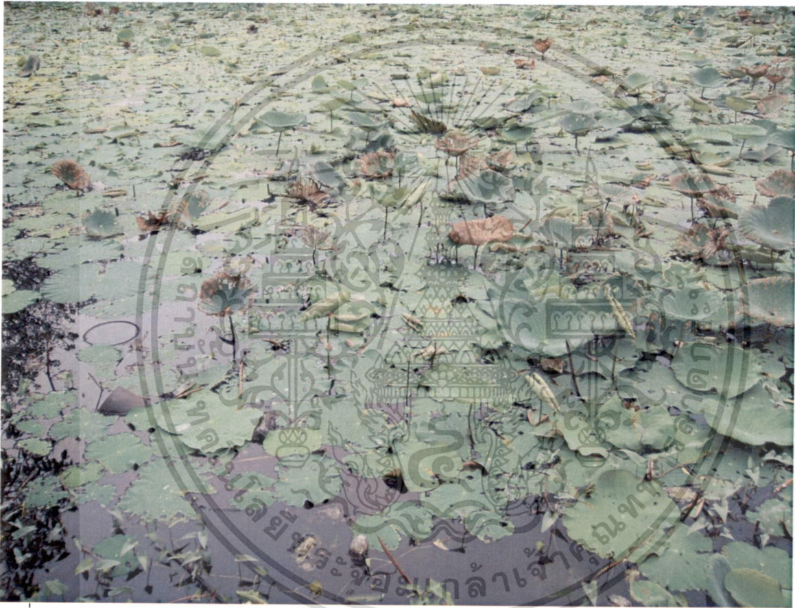
รูปที่ 6 ก้านดอกและก้านใบของบัวหลวง กลมและแข็งแรง มีปมเหมือนหนามเรียงราย

เอกสารนี้เป็นเอกสารที่สงวนไว้สำหรับการใช้งานเพื่อการศึกษาเท่านั้น ไม่อนุญาตให้นำไปใช้ประโยชน์ด้านการค้า ไม่ว่ากรณีใดๆทั้งสิ้น อีกทั้งห้ามมิให้ดัดแปลงเนื้อหา และต้องอ้างอิงถึงเจ้าของเอกสารทุกครั้งที่มีการนำไปใช้