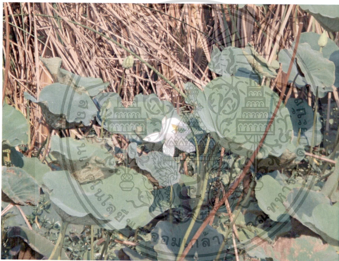
รูปที่ 5 บัวพันธุ์ดอกสีขาว

เอกสารนี้เป็นเอกสารที่สงวนไว้สำหรับการใช้งานเพื่อการศึกษาเท่านั้น ไม่อนุญาตให้นำไปใช้ประโยชน์ด้านการค้า ไม่ว่ากรณีใดๆทั้งสิ้น อีกทั้งห้ามมิให้ตัดแปลงเนื้อหา และต้องอ้างอิงถึงเจ้าของเอกสารทุกครั้งที่มีการนำไปใช้