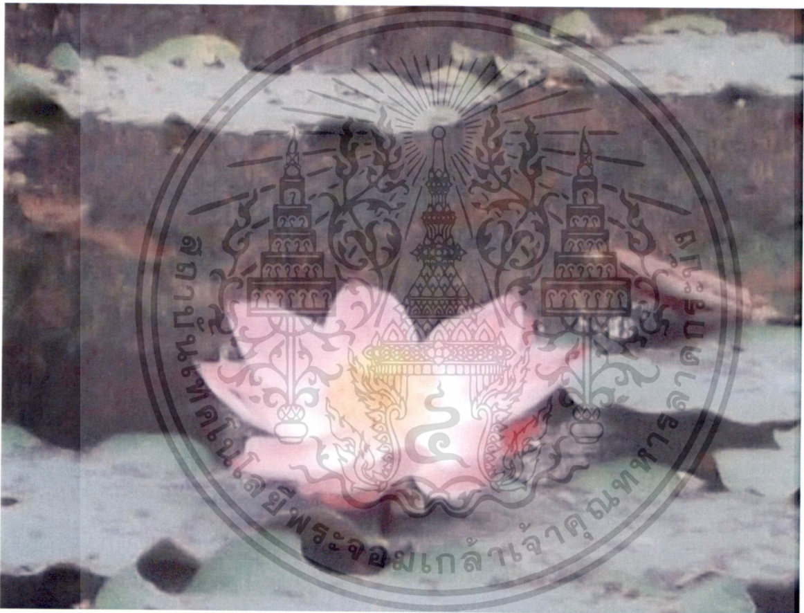
รูปที่ 4.บัวพันธุ์ดอกชมพูแหลม

เอกสารนี้เป็นเอกสารที่สงวนไว้สำหรับการใช้งานเพื่อการศึกษาเท่านั้น ไม่อนุญาตให้นำไปใช้ประโยชน์ด้านการค้า ไม่ว่าจะกรณีใดๆทั้งสิ้น อีกทั้งห้ามมิให้ดัดแปลงเนื้อหา และต้องอ้างอิงถึงเจ้าของเอกสารทุกครั้งที่มีการนำไปใช้