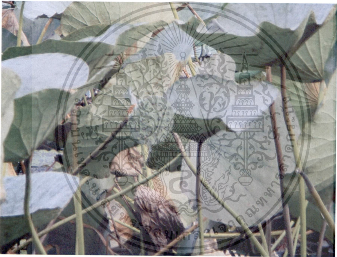
รูปที่ 7 ฝักบัวมีทั้งเมล็ดบัวที่สมบูรณ์และไม่สมบูรณ์

เอกสารนี้เป็นเอกสารที่สงวนไว้สำหรับการใช้งานเพื่อการศึกษาเท่านั้น ไม่อนุญาตให้นำไปใช้ประโยชน์ด้านการค้า ไม่ว่าจะกรณีใดๆทั้งสิ้น อีกทั้งห้ามมิให้ดัดแปลงเนื้อหา และต้องอ้างอิงถึงเจ้าของเอกสารทุกครั้งที่มีการนำไปใช้