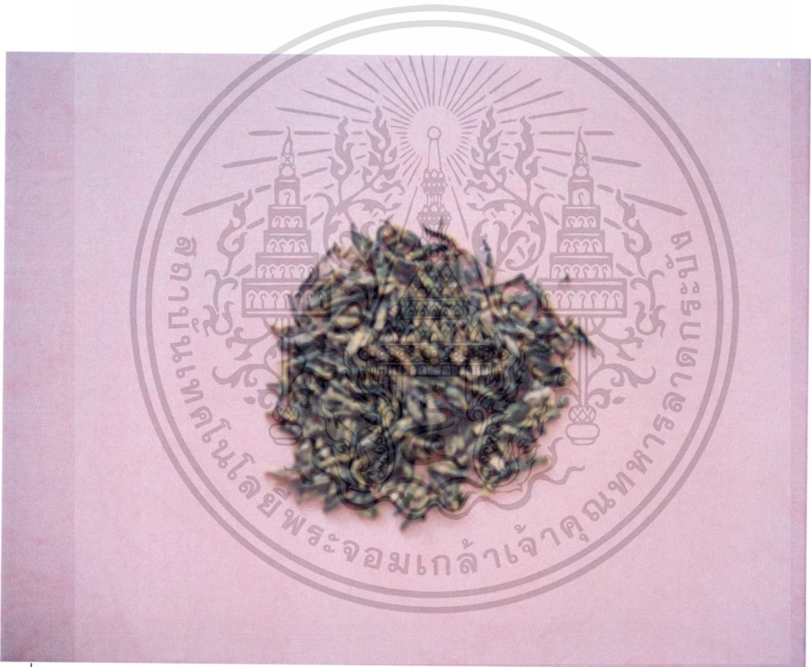
รูปที่ 8 ดีบัว

เอกสารนี้เป็นเอกสารที่สงวนไว้สำหรับการใช้งานเพื่อการศึกษาเท่านั้น ไม่อนุญาตให้นำไปใช้ประโยชน์ด้านการค้า ไม่ว่ากรณีใดๆทั้งสิ้น อีกทั้งห้ามมิให้ตัดแปะเป็นรูป 121368 ต้องอ้างอิงถึงเจ้าของเอกสารทุกครั้งที่มีการนำไปใช้