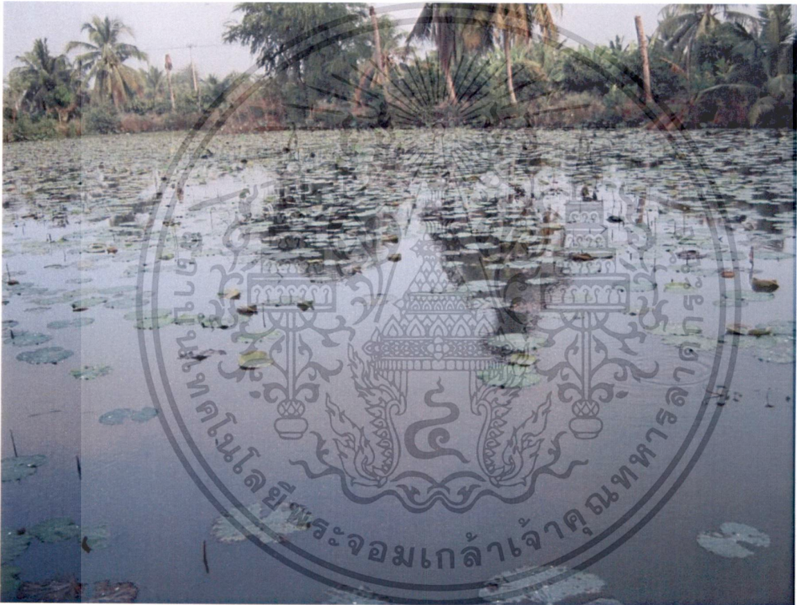
รูปที่ 1 แปลงบัวของเกษตรกรที่ทำการป้องกันแมลงโดยวิธีเขตกรรม

เอกสารนี้เป็นเอกสารที่สงวนไว้สำหรับการใช้งานเพื่อการศึกษาเท่านั้น ไม่อนุญาตให้นำไปใช้ประโยชน์ด้านการค้า ไม่ว่าจะกรณีใดๆทั้งสิ้น อีกทั้งห้ามมิให้ดัดแปลงเนื้อหา และต้องอ้างอิงถึงเจ้าของเอกสารทุกครั้งที่มีการนำไปใช้