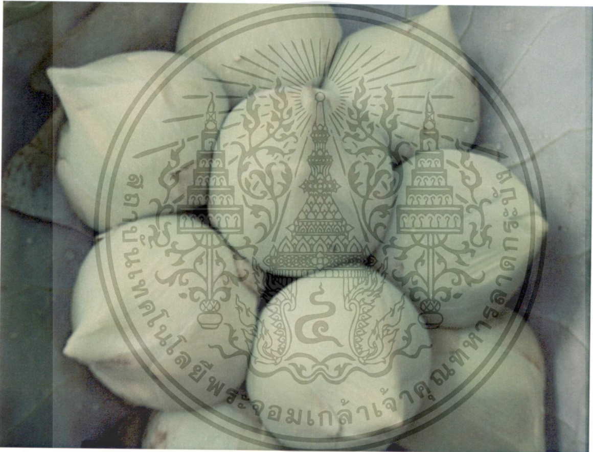
รูปที่ 2 ดอกบัวหลวงพันธุ์สัตตบุษย์

เอกสารนี้เป็นเอกสารที่สงวนไว้สำหรับการใช้งานเพื่อการศึกษาเท่านั้น ไม่อนุญาตให้นำไปใช้ประโยชน์ด้านการค้า ไม่ว่ากรณีใดๆทั้งสิ้น อีกทั้งห้ามมิให้ดัดแปลงเนื้อหา และต้องอ้างอิงถึงเจ้าของเอกสารทุกครั้งที่มีการนำไปใช้