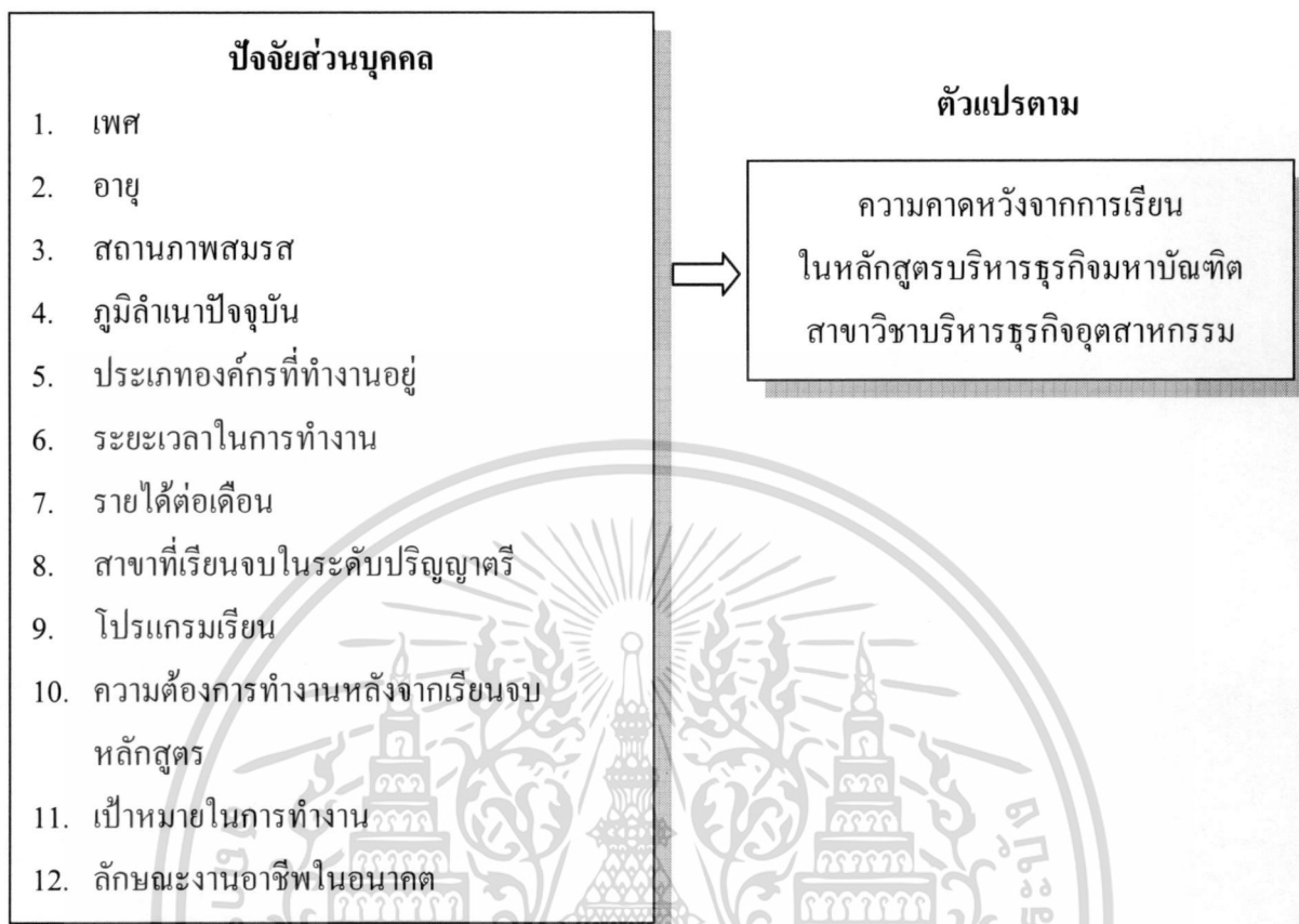
ภาพที่ 1.1 แสดงถึงกรอบแนวความคิดในการวิจัย