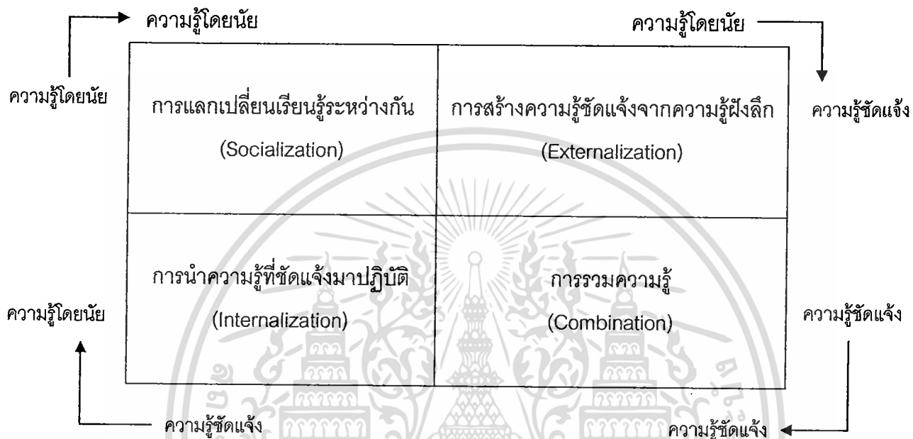
รูปที่ 3 กระบวนการเปลี่ยนแปลงความรู้ ของ SECI Model

โดยกระบวนการของ SECI Model 4 ขั้นตอน จะเป็นกระบวนการต่อเนื่องเป็นวงจร (Nonaka and Takeuchi. 2000) ดังนี้