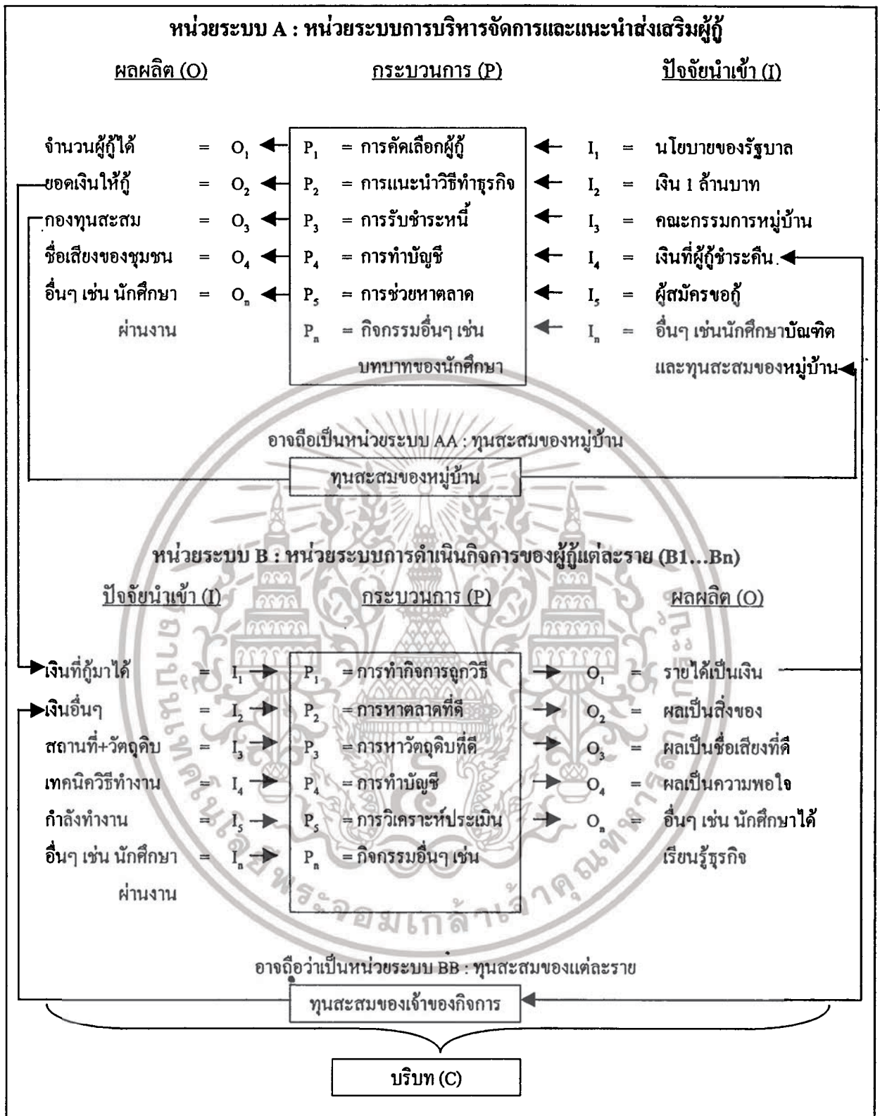
ภาพที่ 2.1 แสดงระบบการทำงานของโครงการกองทุนหมู่บ้านและชุมชนเมือง

เอกสารนี้เป็นเอกสารที่สงวนไว้สำหรับการใช้งานเพื่อการศึกษาเท่านั้น ไม่อนุญาตให้นำไปใช้ประโยชน์ด้านการค้า ไม่ว่าจะกรณีใดๆทั้งสิ้น อีกทั้งห้ามมิให้ดัดแปลงเนื้อหา และต้องอ้างอิงถึงเจ้าของเอกสารทุกครั้งที่มีการนำไปใช้