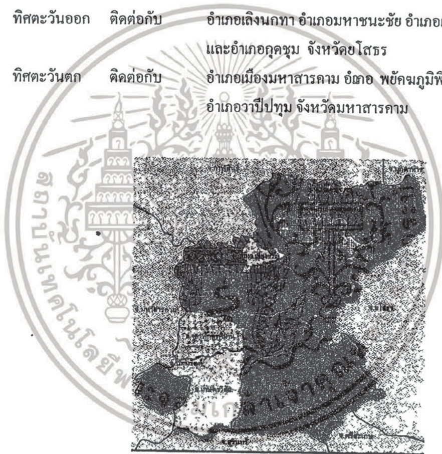
ภาพที่ 2.2 แสดงแผนที่ตั้งและอาณาเขตจังหวัดร้อยเอ็ด