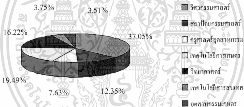
รูปที่ 4.3 ร้อยละของนักศึกษาตัวอย่างจำแนกตามคณะ

จากตารางที่ 4.3 และรูปที่ 4.3 จะพบว่า นักศึกษาตัวอย่างมาจากทุกคณะ คือ จากคณะ วิศวกรรมศาสตร์ร้อยละ 37.05 คณะสถาปัตยกรรมศาสตร์ร้อยละ 12.35 คณะครุศาสตร์อุตสาหกรรม ร้อยละ 7.63 คณะเทคโนโลยีการเกษตรร้อยละ 19.49 คณะวิทยาศาสตร์ร้อยละ 16.22 คณะ เทคโนโลยีสารสนเทศร้อยละ 3.75 และคณะอุตสาหกรรมเกษตรร้อยละ 3.51