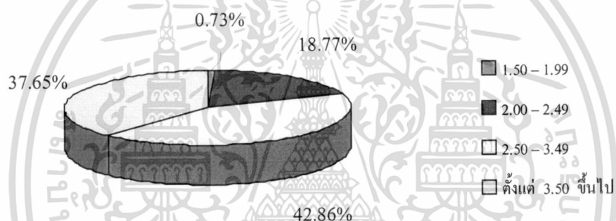
รูปที่ 4.4 ร้อยละของนักศึกษาตัวอย่างจำแนกตามเกรดเฉลี่ยสะสม

จากตารางที่ 4.4 และรูปที่ 4.4 จะพบว่า นักศึกษาตัวอย่างส่วนใหญ่ได้เกรดเฉลี่ยสะสม 2.50 – 3.49 ร้อยละ 42.86 รองลงมาได้เกรดเฉลี่ยสะสมตั้งแต่ 3.50 ขึ้นไป ร้อยละ 37.65 ในขณะที่ได้เกรดเฉลี่ยสะสม 2.00 – 2.49 และ 1.50 – 1.99 ร้อยละ 18.77 และ 0.73 ตามลำดับ