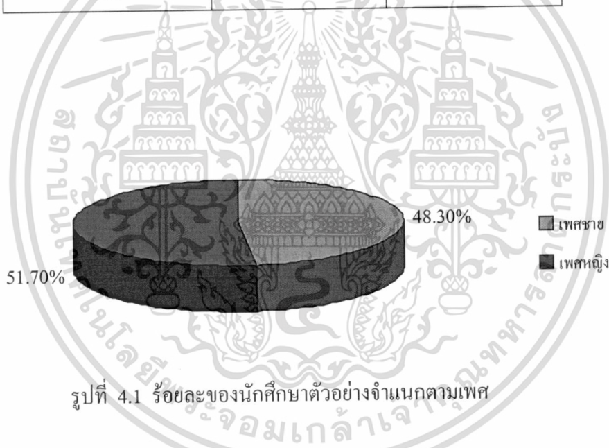
รูปที่ 4.1 ร้อยละของนักศึกษาตัวอย่างจำแนกตามเพศ

จากตารางที่ 4.1 และรูปที่ 4.1 จะพบว่า นักศึกษาตัวอย่างเป็นเพศชายร้อยละ 48.30 และเพศหญิงร้อยละ 51.70