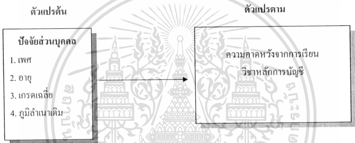
ภาพที่ 1.1 แสดงถึงกรอบแนวคิดในการวิจัย

จากการศึกษาแนวคิดของ G.W. Allport (อ้างใน ครุณี มโนรัตน์. 2544: 25) เรื่องการวัดความคาดหวังได้กล่าวว่า เป็นบทบาทที่สังคมคาดหวังให้บุคคลปฏิบัติ กล่าวคือ บทบาทนั้นจะถูกกำหนดขึ้นโดยสังคมและเป็นไปตามสถานภาพที่บุคคลนั้นดำรงอยู่ นอกจากแนวคิดนี้แล้ว Henry A. Mersay (อ้างใน ครุณี มโนรัตน์. 2544: 27) เช่นกัน ก็ได้ให้แนวคิดเกี่ยวกับความคาดหวังในบทบาท ซึ่งแสดงออกมาในรูปของการกระทำที่บุคคลคิดว่า ควรทำตามสิทธิหรือหน้าที่ในตำแหน่งนั้นๆ ที่ตนครอบครองอยู่ มาใช้เป็นแนวทางในการกำหนดกรอบแนวคิดของความคาดหวังในงานวิจัยครั้งนี้ โดยทำการศึกษาปัจจัยส่วนบุคคลของนักศึกษาในสถาบันเทคโนโลยีพระจอมเกล้าเจ้าคุณทหารลาดกระบังที่ลงทะเบียนเรียนวิชาหลักการบัญชี อันได้แก่ เพศ อายุ เกรดเฉลี่ย และภูมิลำเนาเดิม ซึ่งอาจมีผลต่อความคาดหวังของนักศึกษาจากการเรียนวิชาหลักการบัญชี ดังนั้น ผู้วิจัยจึงได้นำเสนอกรอบแนวคิดในการวิจัยดังนี้