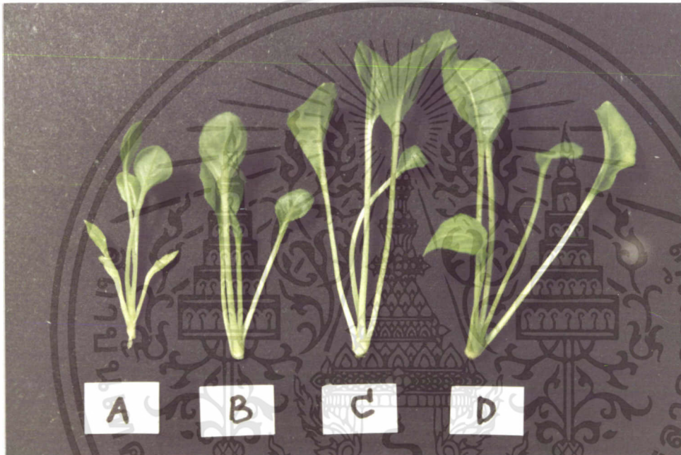
ภาพที่ 1 : เปรียบเทียบความสมบูรณ์ของต้นเขอปปี้ราที่มีระยะเวลาในการให้แสง 12 16 20 และ 24 ชั่วโมงต่อวัน จากการเพาะเลี้ยงครั้งที่ 1 เป็นเวลา 6 สัปดาห์