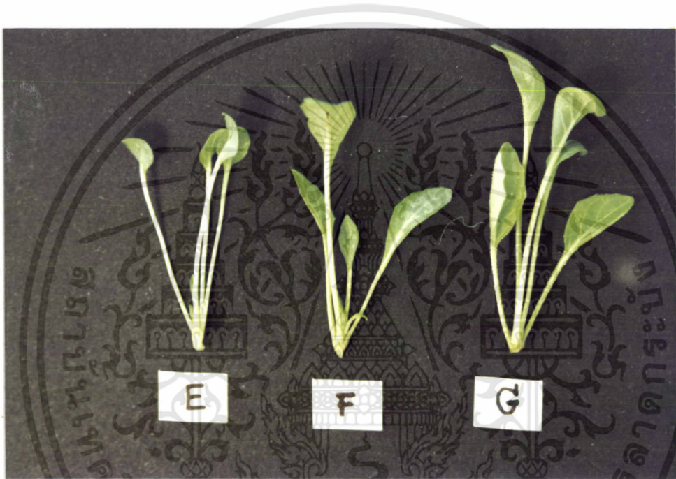
ภาพที่ 2 : เปรียบเทียบความสมบูรณ์ของต้นเขอปร่าที่ได้รับความเข้มแสง 1,500 3,000 และ 5,000 lux

จากการเพาะเลี้ยงครั้งที่ 1 เป็นเวลา 6 สัปดาห์